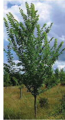
Orme Lutèce® Ulmus x 'Nanguen'