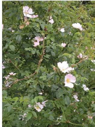
Eglantier Rosa canina