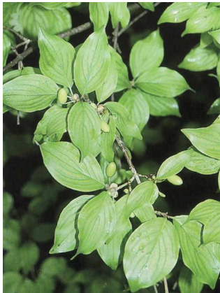
Cornouiller mâle Cornus mas