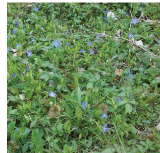
Tapis de petite pervenche Vinca minor