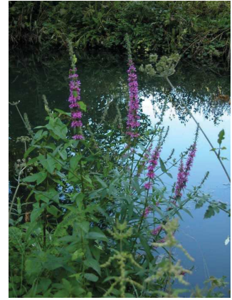
Salicaire Lythrum salicaria