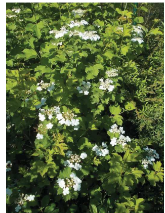
Viorne obier Viburnum opulus