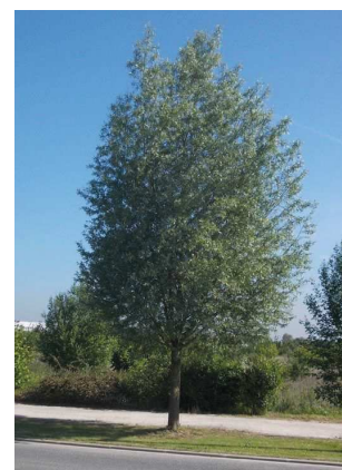
Saule blanc Salix alba