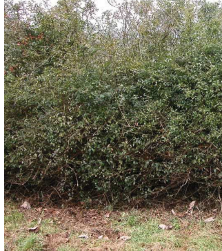
Troène commun Ligustrum vulgare