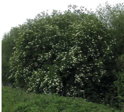
Sureau noir Sambucus nigra