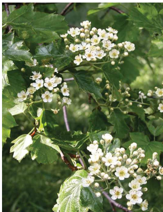
Alisier torminal Sorbus torminalis