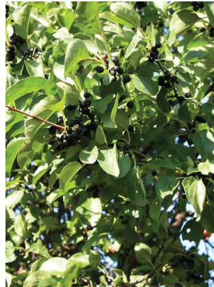
Nerprun purgatif Rhamnus catharticus