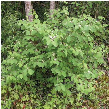
Chèvrefeuille des haies Lonicera xylosteum

La strate arbustive s'appuie également sur des essences à caractère local comme le chèvrefeuille des haies, le cornouiller sanguin, l'églantier, le nerprun purgatif, le prunellier, le troène commun et la viorne lantane.