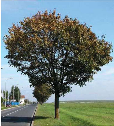
Erable sycomore Acer pseudoplatanus