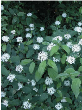
Cornouiller sanguin Cornus sanguinea

Implantés sur les merlons, les arbustes des couverts devront se développer en situation desséchante. Les espèces retenues sont le cornouiller sanguin, l'églantier, le nerprun purgatif et le troène commun.