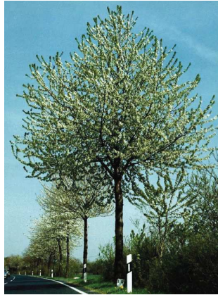
Merisier Prunus avium