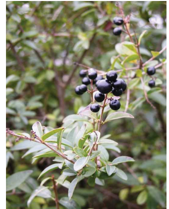
Troène commun Ligustrum vulgare