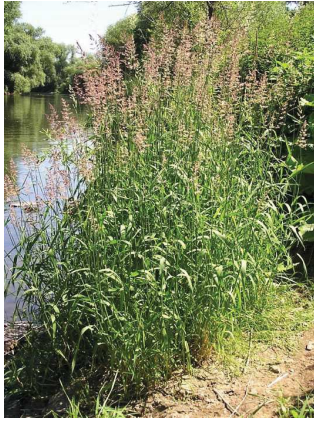
Baldingère Phalaris arundinacea