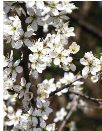
Prunellier Prunus spinosa