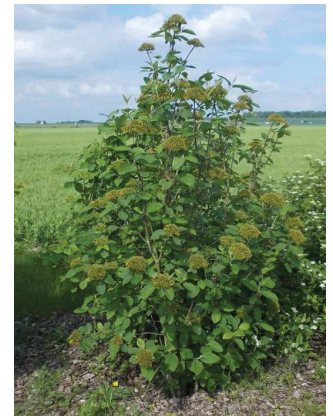
Viorne lantane Viburnum lantana