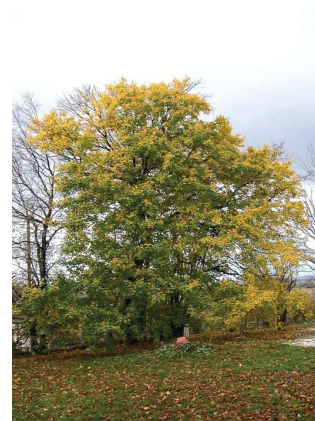
Erable champêtre Acer campestre