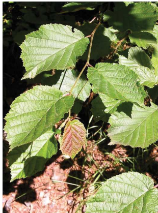
Noisetier Corylus avellana