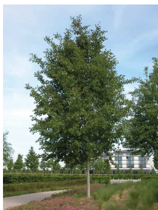
Peuplier tremble Populus tremula