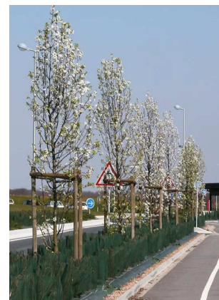
Poirier à fleurs Chanticleer Pyrus calleryana 'Chanticleer'