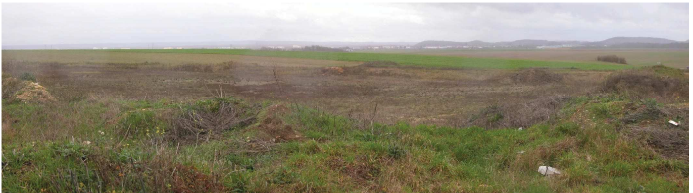
Suite du panoramique ci-dessus