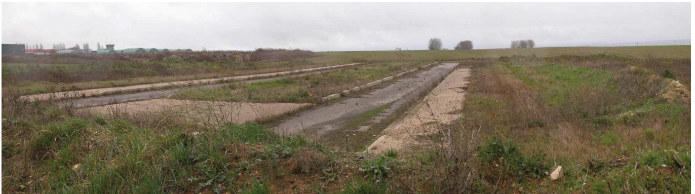
Montage panoramique photographié depuis l'extrémité de la rue Henri Potez et en direction de la parcelle

Le terrain aujourd'hui occupé par des cultures céréalières, est pentu de l'est vers l'ouest ; le point le plus haut se trouvant à la cote 93,87 et celui le plus bas à la cote 81,52, soit une déclivité de près de 12,50 mètres.