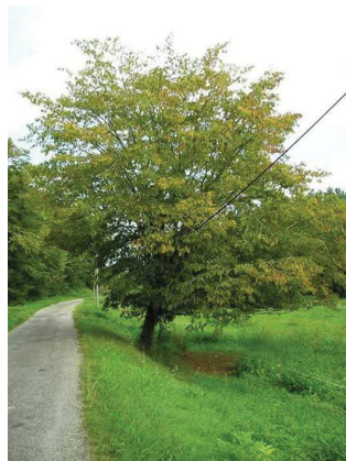
Charme commun Carpinus betulus