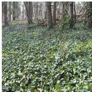
Tapis de lierre Hedera helix