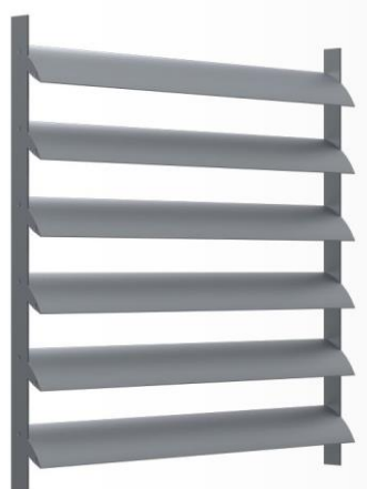
Brise soleil (lames aile d'avion horizontaux en pose verticale)