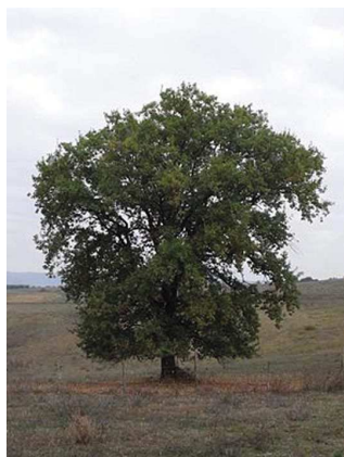
Chêne pubescent Quercus pubescens