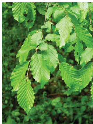
Charme commun Carpinus betulus