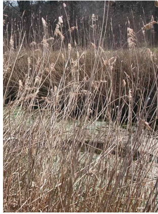
Roseau commun Phragmites communis